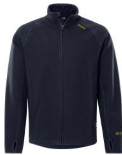
Flame Sweat 7044