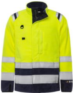
Flame Fleece 4063

Diese Auswahl zeigt unsere Bestseller. Weitere Farben, Modelle und Ausführungen sind auf Anfrage erhältlich