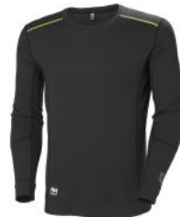
Fyre Crewneck Baselayer