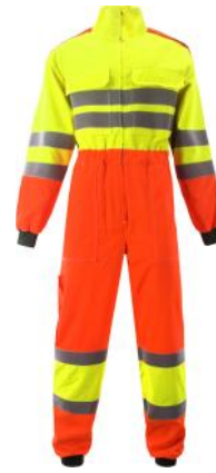
Gaskombi Art.-Nr. PRX67

Zertifizierter Multinorm-Overall für Energie- und Gasarbeiten mit Schutz gegen Hitze, Flammen und Störlichtbogen (Class 1). Antistatisch ausgerüstet und mit begrenztem Chemikalienschutz nach EN 13034.