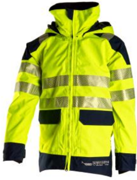
Pyrad GTX Art.-Nr. BSD4615

Hochwertige Multinormjacke mit GORE-TEX PYRAD® Technologie für zuverlässigen Schutz gegen Hitze, Flammen und Störlichtbogen. Wasserdicht, winddicht und atmungsaktiv.